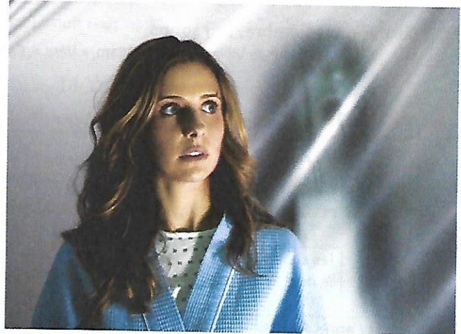
Image tirée du film The Grudge , de Takashi Shimizu, 2004.

* 10 Observe l'image puis surligne dans le texte les mots qui conviennent pour la décrire.